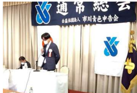
祝辞を述べる 市川税務署 副署長 木暮友伸様